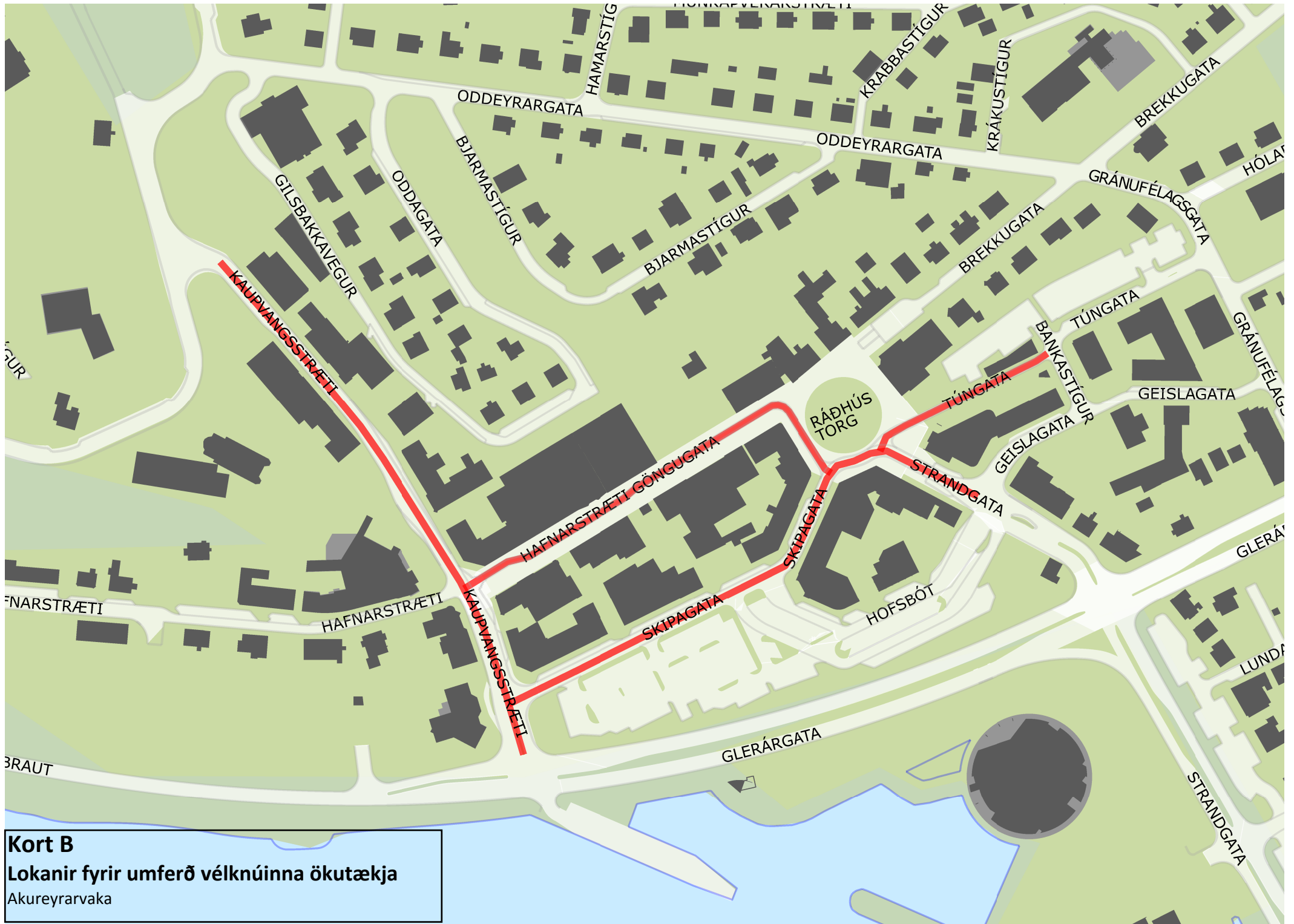
Kort B Lokanir fyrir umferð vélknúinna ökutækja Akureyrarvaka